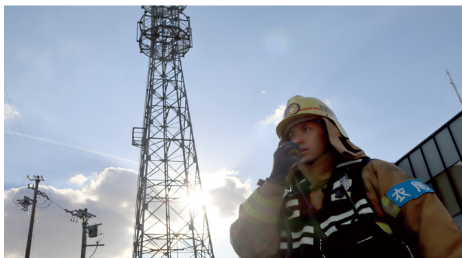
消防救急デジタル無線