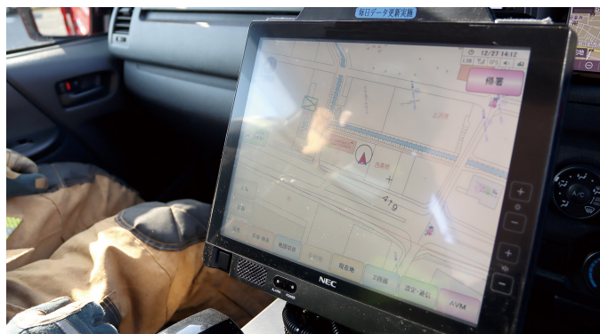
AVM (車両運用端末装置)