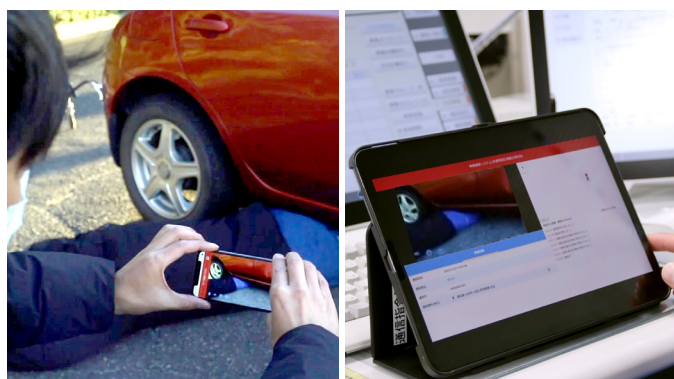
映像通報システム