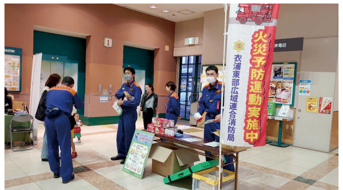
防火キャンペーン