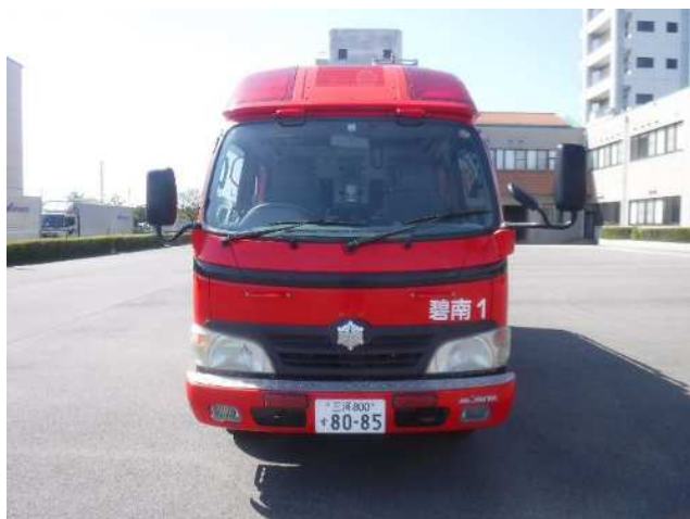
碧南1：三河800 す 8085